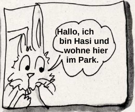
Hasi findet einen Döner.